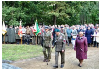
Na okoliczność 70. rocznicy

W Polakach pamięci nie można zamordować!