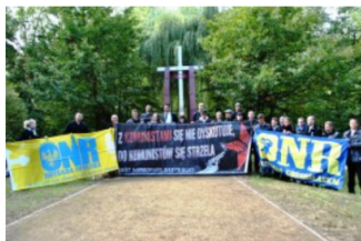
Przy transparenecie „Z

„Możliwą o wieńską Polskę, którą wielu wiernych powtarzało, w tym stojący obok mnie ojciec z synem, a mi nabiegły łzy do oczu. Wybaczą mi Państwo, drodzy czytelnicy, tę osobistą dygresję, ale modlitwa ta była odczytywana z okazji uroczystości ONR, anonimowo, przy zamkniętych kościelnych wrotach, dziś uroczystie recytowana przez wiernych odbija się echem leśnej polny. Zmiany następują niezwykle szybko, „Gazeta Wyborcza” nie nadąża za nimi, nie relacjonuje, boi się, bowiem opluwani przez nią „żołnierze wyklęci” wychodzą z lasu zapomnienia, a wraz z nimi ich wartości i ideały przejmowane przez młode pokolenia Polaków, świadome swej tożsamości, gotowe odpłacić za lata kłamstw i pomówień.